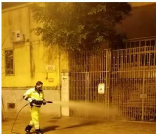
La sanificazione davanti alle scuole di Salerno

Il fatto - Proseguono gli interventi di sanificazione, ad opera della Protezione Civile, delle aree antistanti i plessi scolastici cittadini