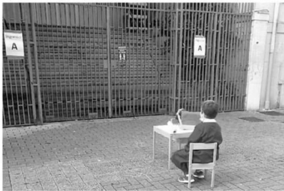
SERVIZI ALLE PAGINE 8 E 5

Il prefetto ai dirigenti: potete chiudere. "Mari" sbarrata, paura alla "Vicinanza"