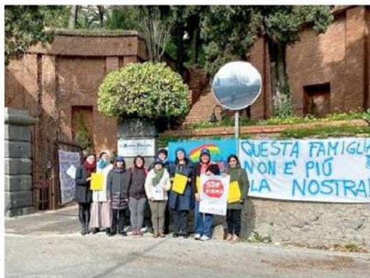
Una manifestazione di protesta all'ingresso della struttura

I sindacati annunciano volantini, presidi e lo stop alle attività straordinarie