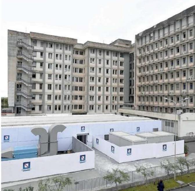
L'area Covid per la terapia intensiva dell'ospedale "Ruggi" di Salerno

Il report dell'Unità di Crisi. Mentre nel Salernitano si piangono altre vittime provocate dal "mostro invisibile", la curva del contagio continua a crescere. E quanto emerge dai dati diffusi dall'Unità di Crisi della Regione