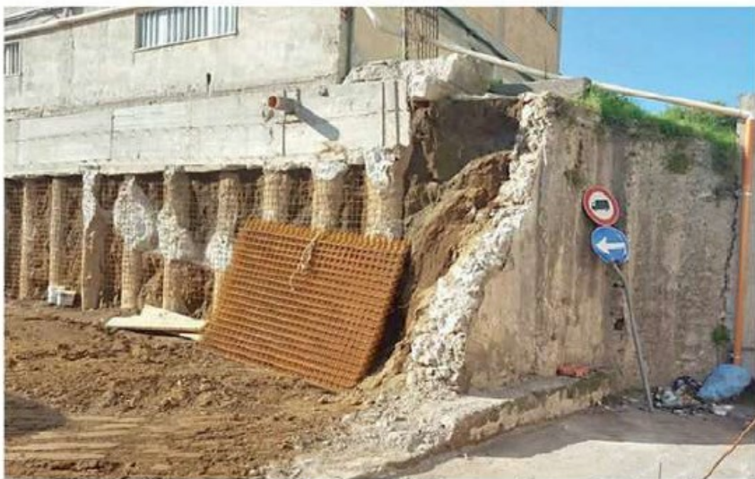
L'esedra di Villa Formosa abbattuta dal Comune di Cava de' Tirreni

Raso al suolo l'emiciclo murario che cinge Villa Formosa, inascoltate le rimostranze degli intellettuali